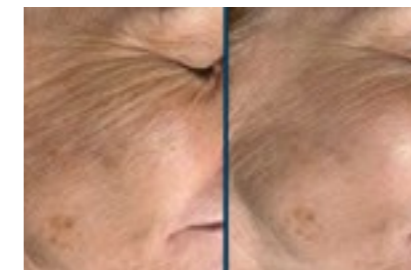
Feine Linien und Fältchen